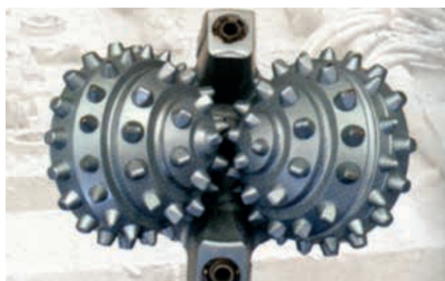
Ryc. 14. Świder gryzowy firmy Transco MFG Australia PTY. Ltd.

Drugim urządzeniem jest świder gryzowy, produkowany w dwóch nowych wielkościach, tj. 9-7/8" oraz 12-1/4". Świder gryzowy przedstawiono na rycinie 14.