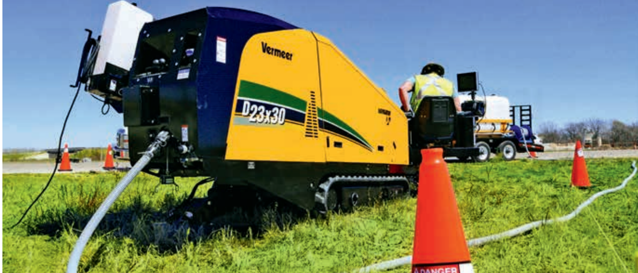
Ryc. 15. Wiertnica D23x30 S3 Navigator firmy Vermeer

światłowodowych. Posiadają silnik Tier 4 Final, spełniający normy emisji zanieczyszczeń zarówno w Ameryce Północnej, jak i Europie, a ich układ hydrauliczny zapewnia możliwie największą wydajność i optymalne wykorzystanie mocy silnika. Aby spełnić wymagania w zakresie wysokiej wydajności przy mniejszych wymiarach urządzenia, średniej wielkości wiertnica Vermeer D23x30 Navigator 11DD S3 oferuje szybkość wciągania 62,8 m/min (206 stóp/min) i prędkość obrotową rzędu 219 obr./min, co odpowiada parametrom uzyskiwanym przez większe wiertnice tej samej klasy. Wiertnica Vermeer D23x30 S3 ma gwarantowany poziom mocy akustycznej równy 99 dB i poziom mocy akustycznej odbieranej przez operatora wynoszący ok. 78,7 dB, co czyni ją jednym z najcichszych urządzeń wiertniczych na rynku. Redukcja hałasu ma za zadanie