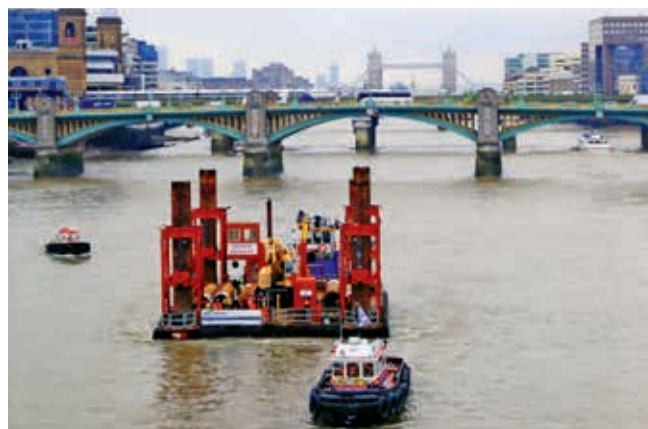
Ryc. 5. Transport barki podtrzymującej dźwig na miejsce budowy

Thames Tideway Tunnel, inaczej zwany Superkanałem, jest największym projektem dotyczącym infrastruktury wodnej w dziejach Wielkiej Brytanii. Prace rozpoczęto w grudniu 2015 r., kiedy na Tamizę wpłynęła pierwsza barka podtrzymująca dźwig (ryc. 5). Barka została ustawiona w miejscu docelowym przez dwie łodzie i do tej pory została użyta do przygotowania nowego mola, które będzie wykorzystywane w trakcie realizacji projektu. Drugim ważnym wydarzeniem dotyczącym tego projektu było otwarcie przez mera Londynu tunelu Lee, pierwszego skończonego unowocześnionego odcinka sieci kanalizacyjnej Londynu. Chociaż tunel Lee nie jest bezpośrednio związany z projektem Superkanału, to docelowo będzie włączony do jego infrastruktury i razem z nim będzie pełnił ważną funkcję. Dodatkowo na uwagę zasługuje fakt, że tunel Lee, znajdując się 75 m pod powierzchnią ziemi, jest najgłębiej wbudowanym tunelem w historii Londynu.