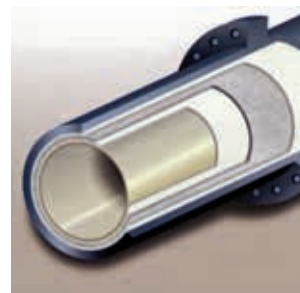
Ryc. 10. Przekrój przez przewód z zastosowaną powłoką AquaCure PS®

Firma Applied Felts oferuje najwyższej jakości powłokę CIPP AquaCure PS® (ryc. 10) dla rur kanalizacji ciśnieniowej oraz ciśnieniowych przewodów wodociągowych transportujących wody nieprzeznaczone do spożycia. Powłoka charakteryzuje się bardzo wysoką odpornością na ciśnienie wewnętrzne przy zachowaniu najlepszych możliwych parametrów hydraulicznych i konstrukcyjnych.