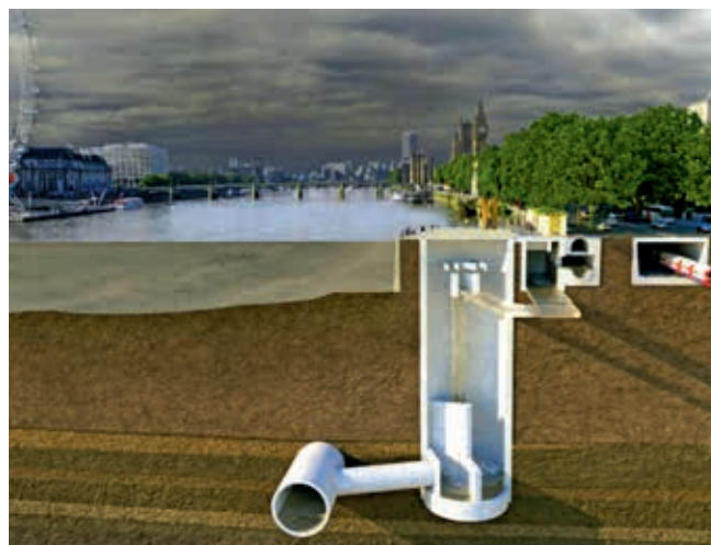
Ryc. 6. Schemat tunelu Thames Tideway

Projekt Thames Tideway Tunnel (ryc. 6) obejmuje prace na 24 placach budowy w 14 dzielnicach Londynu, przejścia pod 1301 budynkami, budowę 75 mostów, 20 km ścian bocznych i 50 innych obiektów na rzece, 45 tuneli, 24 km gazociągów, 15 km wodociągów oraz 18 km kanalizacji. Na rycinie 7 pokazano tarczę do budowy tunelu Lee. Na jego trasie zostanie wybudowanych pięć komór o średnicach 17–25 m i głębokościach do 72 m.