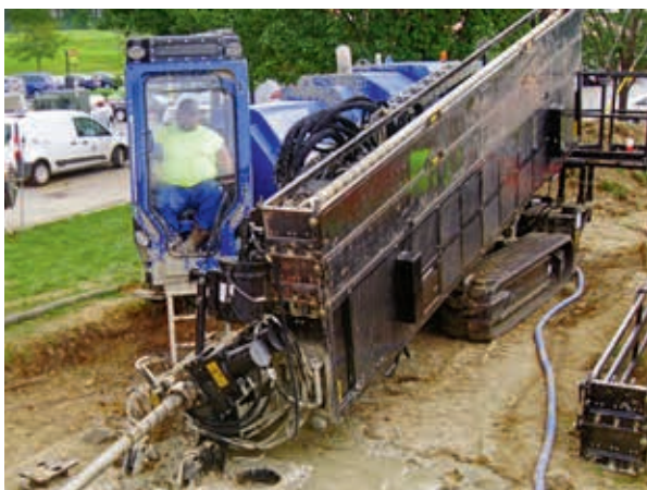
Ryc. 11. Wiertnica HDD, The DD-110, firmy American Augers

Firma American Augers promuje swoją nową wiertnicę HDD o nazwie DD-110 (ryc. 11). Wiertnica dysponuje mocą 20 337 Nm momentu obrotowego, a przegubowo zainstalowana kabina operatora daje wyjątkową widoczność i komfort. Wprowadzono też nowe rozwiązania wspomagające przejście przez wszystkie rodzaje gruntu, np. tłok obrotowy oraz metalową obudowę silnika, umożliwiającą łatwy dostęp i trwałość.