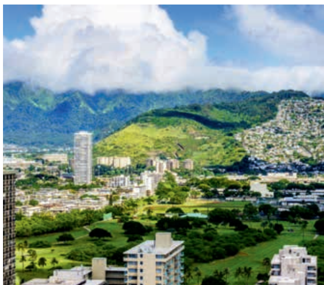
Ryc. 4. Honolulu

penetrację gruntu (GPR), lokalizację infrastruktury podziemnej wraz z nanoszeniem jej na mapy oraz wykonywanie wąsko-średnicowych wykopów w drodze za pomocą koparek ssących. Zgodnie z kontraktem, miała ona zlokalizować ok. 40 sieci podziemnych, które potencjalnie mogłyby zostać uszkodzone przez instalację okręgowej sieci klimatyzacyjnej. Dzięki połączeniu technologii oferowanych przez HGS udało się ustalić głębokość, rozmiar oraz odległość sieci od znanych punktów geodezyjnych. Na tej podstawie firma HGS sporządziła mapy z zaznaczoną zidentyfikowaną infrastrukturą podziemną.