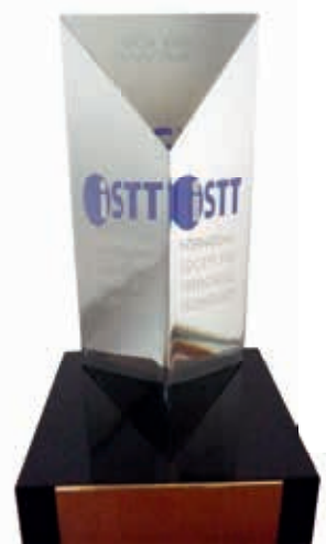
Ryc. 1. Statuetka No-Dig Award