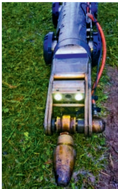
Ryc. 3. Urządzenie do hydrodynamicznego czyszczenia przewodów kanalizacyjnych

Po zapadnięciu decyzji o otwarciu uczelni na terenie dawnej bazy lotniczej Ministerstwa Obrony (Ministry of Defence) w Lyneham konieczna okazała się rehabilitacja znajdującej się tam sieci kanalizacyjnej. Inspekcją i odnową odcinka sieci o długości