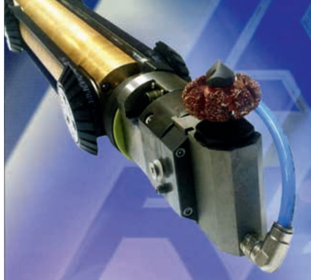
Ryc. 12. Robot z frezem firmy KRE Engineering Services

Firma KRE Engineerin Services oferuje robota z frezem (ryc. 12), zasilanego silnikiem na sprężone powietrze, z głowicą umożliwiającą obrót o 360°, mogącego pracować w średnicach 150–300 mm.