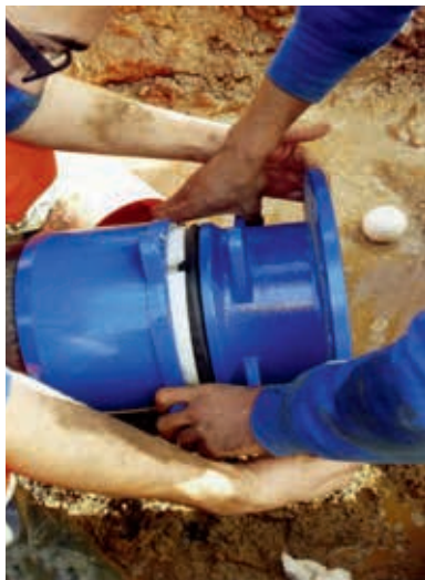
Ryc. 2. Relining przy zastosowaniu powłoki polietylenowej, zbrojonej włóknami syntetycznymi o wysokiej wytrzymałości

Ekipa zajmująca się rehabilitacją zaproponowała odnowę przewodów dostarczających wodę do miasta przy użyciu rękawów z powłoką polietylenową, wzmocnionych włóknami syntetycznymi o wysokiej wytrzymałości (ryc. 2). Wybór ten był podyktowany faktem, że mogą być one wprowadzane w bardzo krótkim czasie i oddawane do użytku stosunkowo szybko.