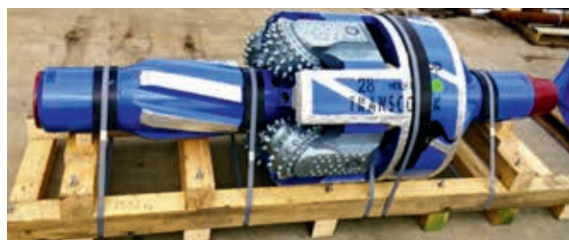
Ryc. 13. Poszerzacz o wielkości 28" firmy Transco MFG Australia PTY. Ltd.

Pierwszym z promowanych przez firmę Transco MFG Australia PTY. Ltd. urządzeń jest poszerzacz typu hole opener o wielkości 28" (711 mm), który został wykorzystany do wykonania otworu w skale bazaltowej dla wbudowania magistrali wodociągowej o długości 1450 m w Hongkongu. Poszerzacz przedstawia rycina nr 13.