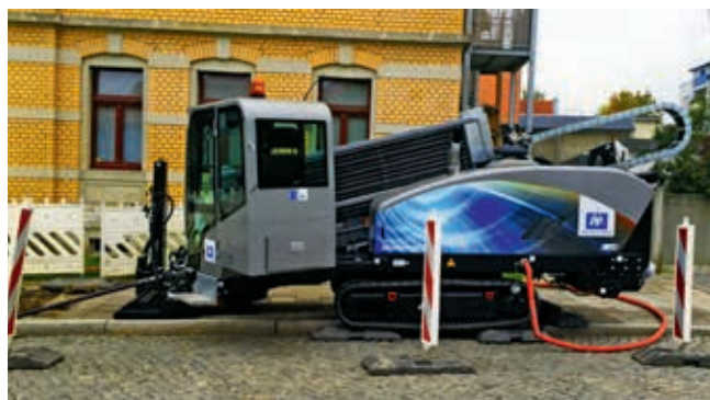
Ryc. 9. Urządzenie Grundodrill 11XP

W związku z szybko rosnącą liczbą mieszkańców Drezno wymaga rozbudowy infrastruktury podziemnej. Na etapie jej projektowania w dzielnicy Lobtau nie wzięto pod uwagę doprowadzenia do niej szerokopasmowego przyłącza internetowego w postaci światłowodów. Duże zagęszczenie sieci podziemnych uniemożliwiło instalację przewodu metodą wykopową, dlatego zdecydowano się na wykorzystanie technologii bezwykopowej w postaci horyzontalnych przewiertów sterowanych (HDD). Do realizacji inwestycji użyto wiertnicy HDD Grundodrill 11XP firmy Tracto-Technik (ryc. 9).